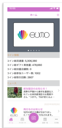
スマートフォンアプリ eumo (ë) 画面イメージ